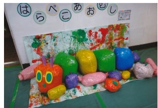
↑小学部1年生の作品